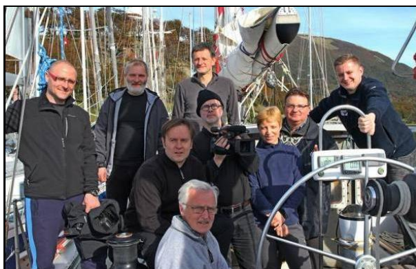
Załoga 1 Etapu, Ziemia Ognista 06.04.2014.