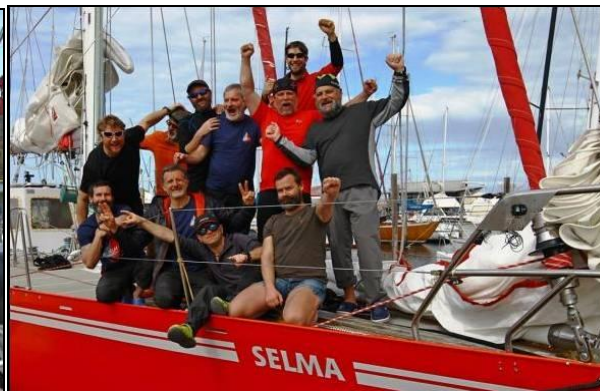
Załoga ostatniego etapu - 04.04.2015 Mar del Plata - Yate Club Argentino.

Ale ważniejsze od liczb jest to co załogi przeżyły na tym stalowym, bezpiecznym jachcie, żeglując razem po najbardziej niedostępnych i najzimniejszych morzach na Ziemi. Szczególnie ostatni etap - prawie trzymiesięczny rejs, jedenastu żeglarzy razem w więcej niż spartańskich warunkach. W sytuacji gdy - nie ma gdzie wyjść ani opcji: spakować się ani wyjechać - DALI RADE. Dlatego największym osiągnięciem Wyprawy było stworzenie grupy wzajemnie wspierających się przyjaciół. Wszystkie pozostałe cele zostały osiągnięte dzięki takiej właśnie atmosferze - wzajemnego zrozumienia i wsparcia.